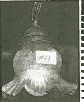
Zu ersteigern: Position 123, antikes Lämpchen mit Glasschirm.

Wer 100 Mark als Kautions hinterlegt, darf mitbieten: Zum Ersten, zum Zweiten – zum Abschied.