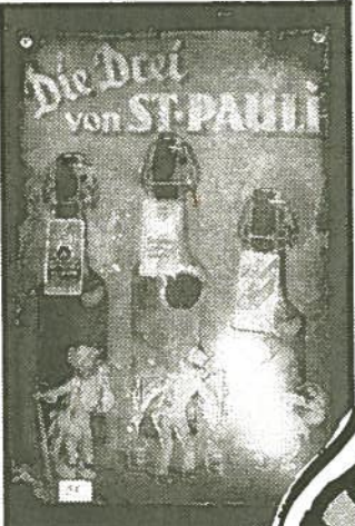
Zu ersteigern: Das älteste Reklameschild aus dem „P8“. Insgesamt gibt's 60 Stück.